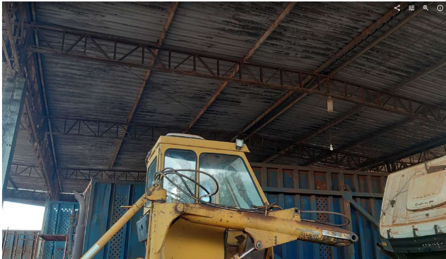
Vista da parte interna da cobertura do Posto Talismã