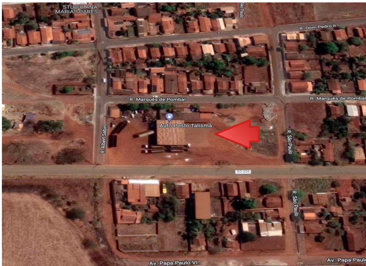
Fig. 2 – imagem Google Maps: seta indica a localização do imóvel na Avenida Bispo de Moura, s/nº, Almeirindonópolis, distrito administrativo de Cachoeira Dourada – GO