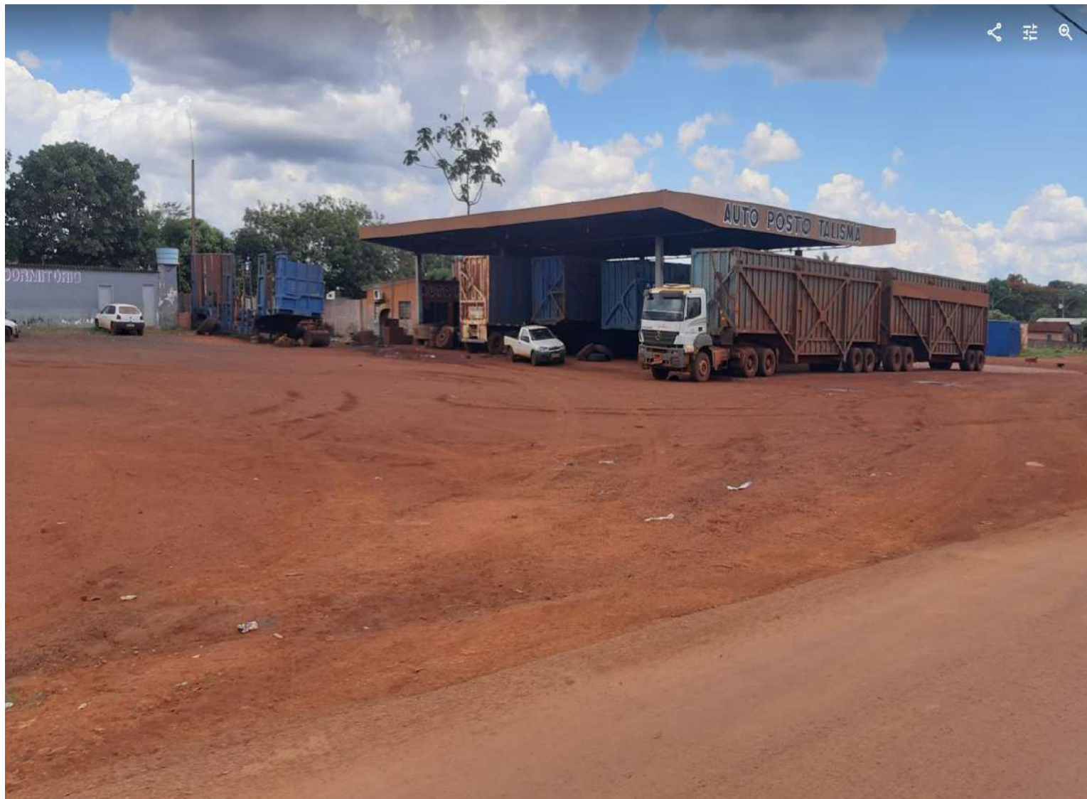
fig. 1 – imagem do dia da vistoria 25 de novembro de 2022, na Avenida Bispo de Moura, s/nº, Almeirindonópolis, distrito administrativo de Cachoeira Dourada – GO