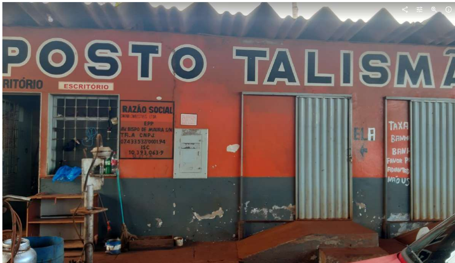
Vista parcial do escritório e banheiros masculino e feminino