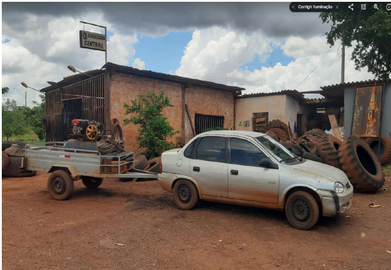
Prédio construído de borracharia