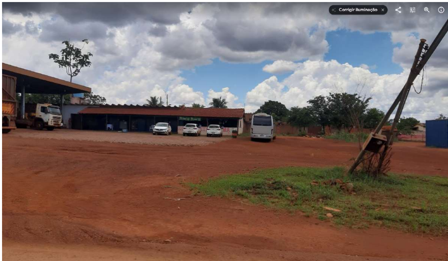
Bloco constituído de bar e restaurante