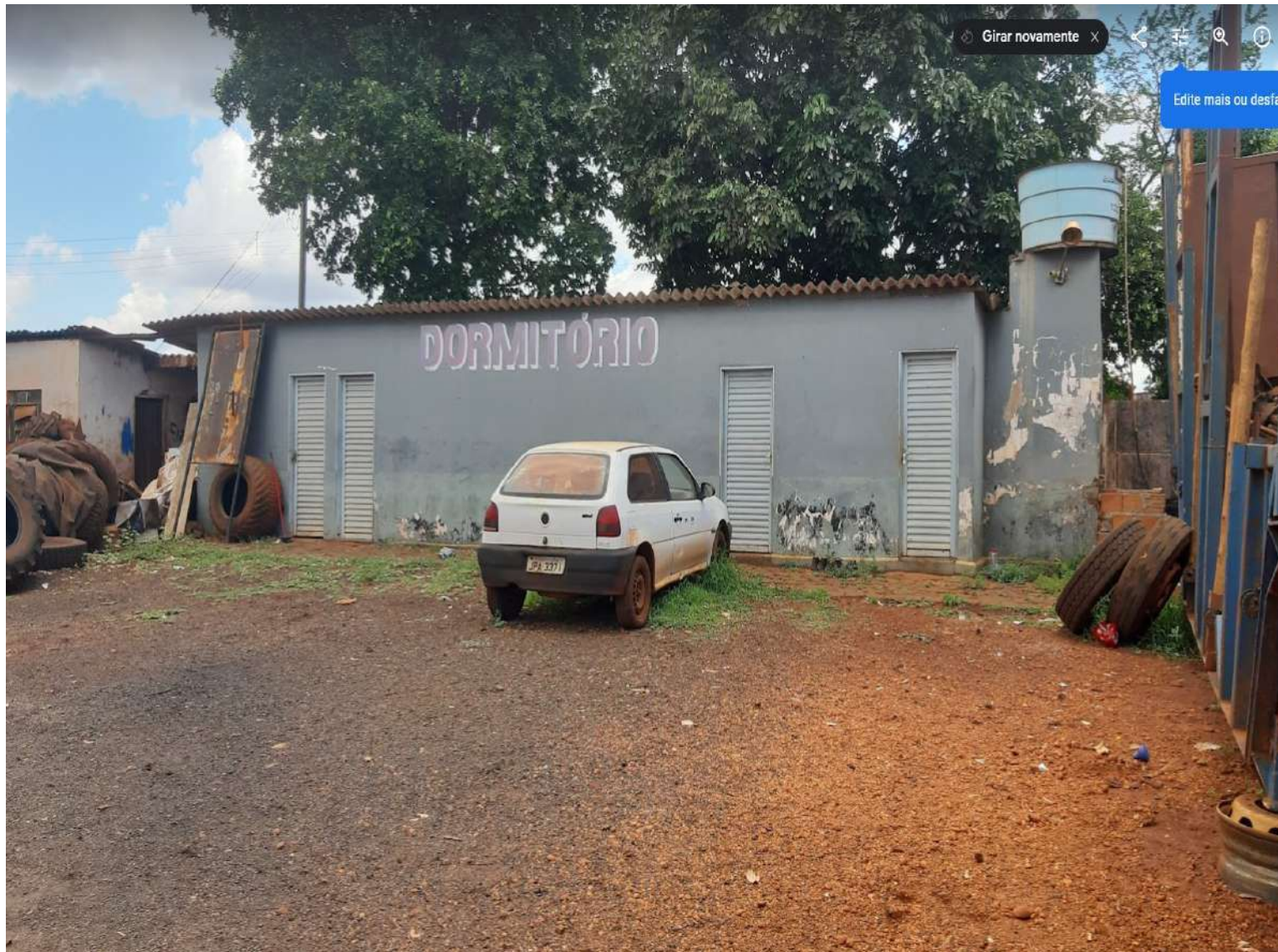
Prédio construído de dormitórios